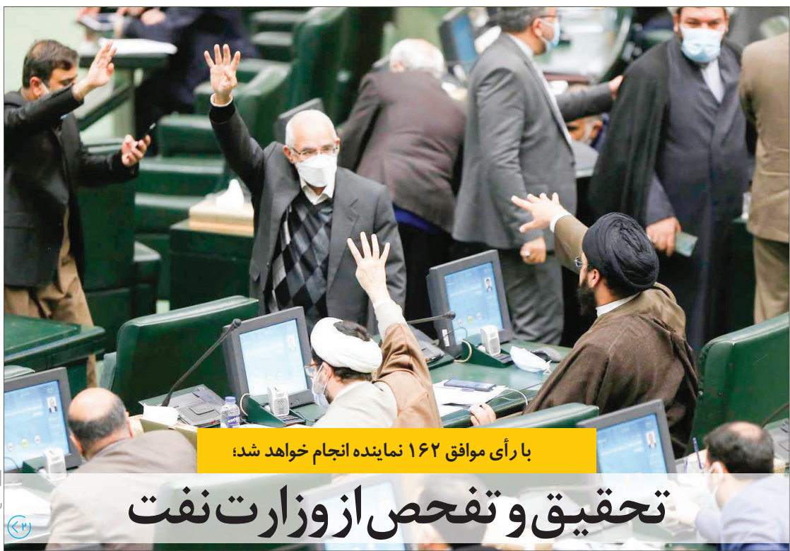
با رأی موافق ۱۶۲ نماینده انجام خواهد شد؛

در باره آینده مذاکرات باید گفت، الان مهم این است که ما خوب بازی می کنیم و دستمان پر است. با قانون مجلس شورای اسلامی در یک سال گذشته آسیب هایی که در بحث هسته های ایجاد شده بود و بخشی از ظرفیت ها از دست داده بودیم، این ظرفیت ها به سرعت دارد ترمیم می شود، هم در بحث ذخیره سازی هم درصد غنی سازی هم بحث نصب سانتر فیوژها با ظرفیت بالاتر. بنابراین الان دست ما پر است و برگه های ارزشمندی داریم. از طرفی تجربه هم کسب کردیم و داریم با قاعده بازی می کنیم.