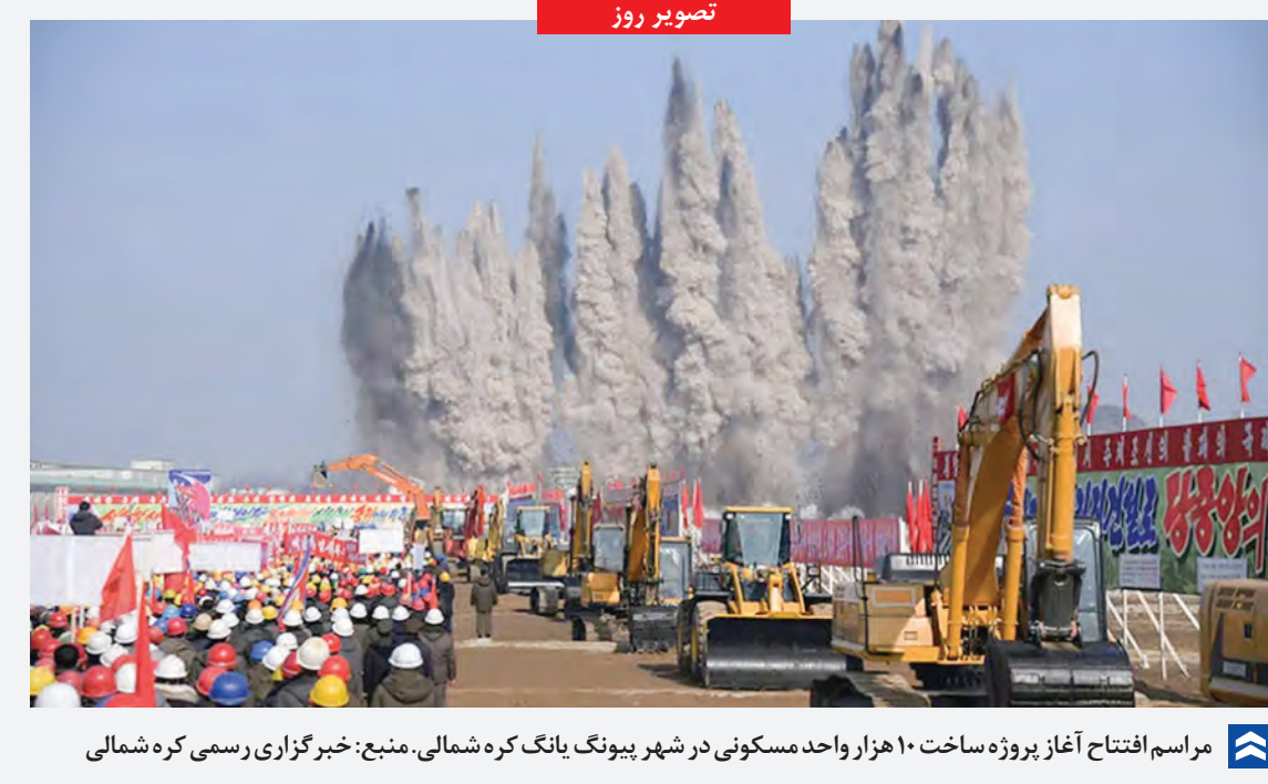
مراسم افتتاح آغاز پروژه ساخت ۱۰ هزار واحد مسکونی در شهر پیونگ یانگ کره شمالی.