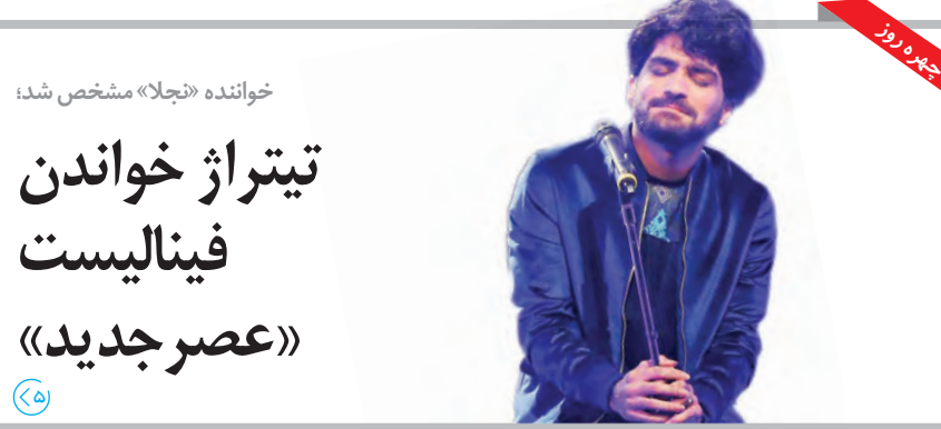
خواننده «نچلا» مشخص شد؛