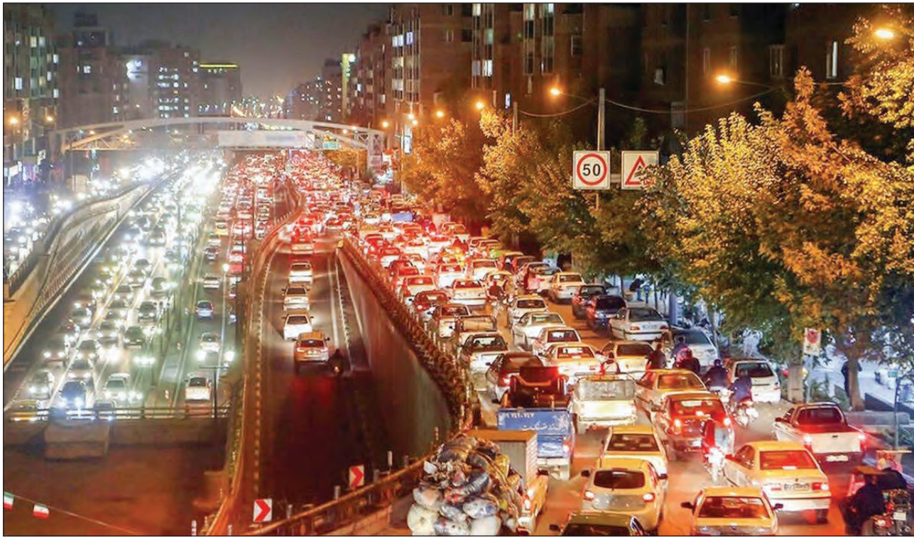
پایتخت سنگین‌ترین ترافیک سال ۱۴۰۰ را تجربه کرد؛