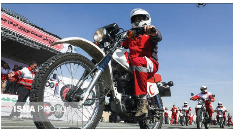
مانور طرح امداد و خدمات به مسافران توریستی هلال احمر برگزار شد.