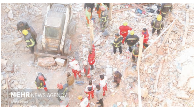
در پی وقوع انفجار یک باب منزل مسکونی در منظره (ابوریحان) تبریز، سه ساختمان مجاور هم تخریب شدند و هفت کشته بر جای گذاشته است.