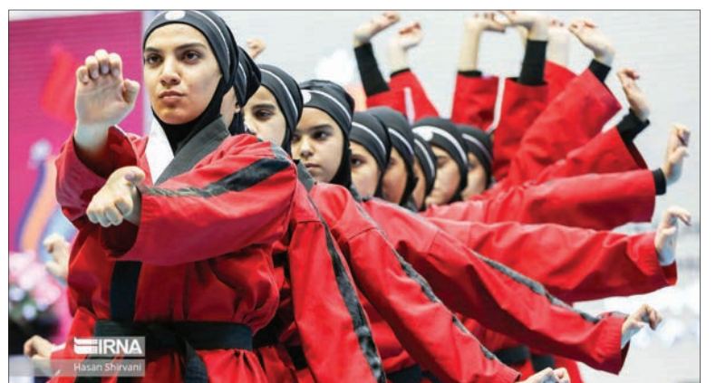
مراسم افتتاحیه نخستین دوره بازی‌های بین‌المللی توریست با حضور «محمد مخبر» معاون اول رئیس‌جمهوری و «انسبه خزعلی» معاون امور زنان و خانواده ریاست جمهوری در تالار بستکبک مجموعه ورزشی آزادی تهران برگزار شد.