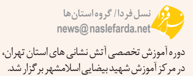
حضور شهرهای فرون آباد، شمشک و در بندسر، پرنده، قرچک، احمد آباد مستوفی، صفادشت، بومهن و شریف آباد برگزار و در پایان دوره از شرکت کنندگان آزمون کتبی و عملی اخذ شد.