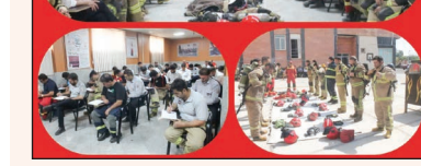
حضور شهرهای فرون آباد، شمشک و در بندسر، پرنده، قرچک، احمد آباد مستوفی، صفادشت، بومهن و شریف آباد برگزار و در پایان دوره از شرکت کنندگان آزمون کتبی و عملی اخذ شد.