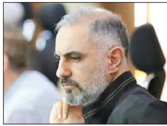
رأی‌نما داریی / گروه استان‌ها news@nasleforda.net

سیاست‌های اصلاحی در مدیریت منابع در برنامه‌های آبی شهرداری گنجانده شود رئیس کمیسیون سلامت، محیط‌زیست و خدمات شهری شورای اسلامی شهر کرج به ورود شهرداری به موضوع جمع آوری و ساماندهی آبهای سطحی تاکید کرد و گفت: آبهای سطحی با هدف پیشگیری از آلودگی معابر و تقویت سفره های زیر زمینی در زمان بارش ها مهابار شود.