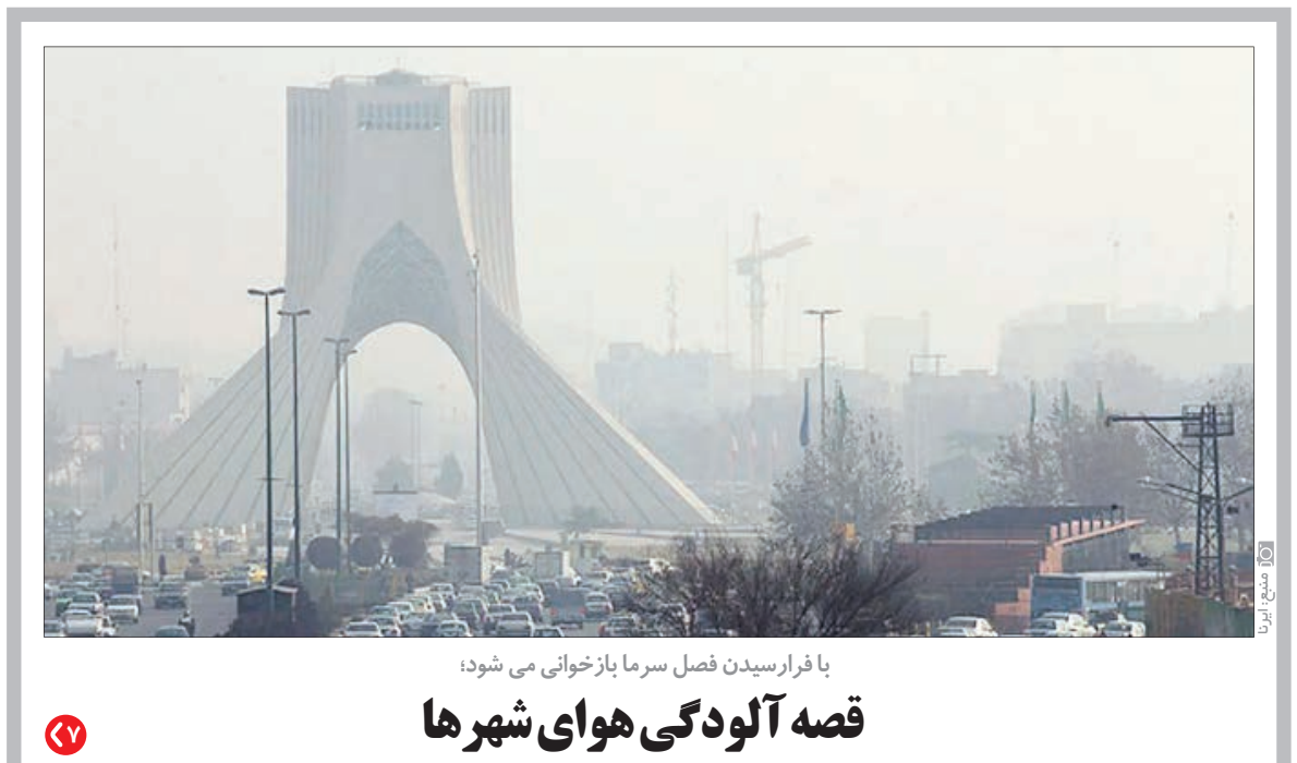
با فرارسیدن فصل سرما بازخوانی می‌شود؛

اقتصاد آیا گرانی قیمت خودرو کلید خورد؟ معاون جهاد کشاورزی استان گلستان خبر داد؛