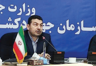
نسل فردا / گروه استان‌ها news@naslefarda.net

رئیس سازمان جهاد کشاورزی گلستان با اشاره به روش کشاورزی حفاظتی در کاشت محصولات پاپیزه گفت: مهمترین عامل تولید در دیمزارها رطوبت است بنابراین می‌توان از این روش برای افزایش تولید بهره‌برد.