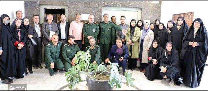
نسل فردا / گروه استان‌ها news@naslefarda.net

نمایشگاه اسوه استانی در تالار قرآن با حضور ۲۸ پایگاه بسیج آغاز به کار کرد. نماینده ولی فقیه در استان همدان روز سه شنبه در همایش محلات مردم سالار در همدان و افتتاح این نمایشگاه با بیان اینکه بسیج برای حل مشکلات مختلف جامعه ظرفیت دارد، گفت: از این ظرفیت باید به شکل مطلوب و جدی استفاده کرد.