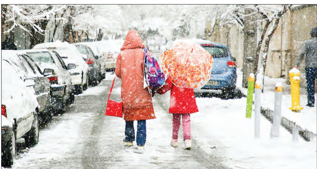
با ورود سامانه جدید به کشور از امروز: