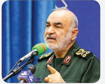
فرمانده کل سپاه گفت: مردم برای نیروهای مسلح بسیار مقدس اند؛ ما نگاهمان این است که مردم، قدرت و پشتوانه اصلی این کشور در همه ابعادند؛ ما در صیانت

از مردم هر چه بتوانیم تلاش می کنیم. در سپاه پاسداران با قطر ه های خونمان پیمان بسته ایم که تا آخر پای این مردم بمانیم، هرگز میدان را ترک نکنیم و عرصه های وفاداری و فداکاری و خدمت را برای خودمان به نیت خدمت به مردم باز کنیم. ما حس مردم پاری را بر اساس حکمت ها و باور هایی که رهبر عزیزمان فرموده اند در همه ابعاد به کار می بندیم تا به مردم در حوزه های محرومیت زدایی، آپرسانی، ایجاد شهرک ها و خدمات درمانی به شکل پیوسته و زنجیروار در نوار ساحلی به نحو احسن گسترش دهیم.