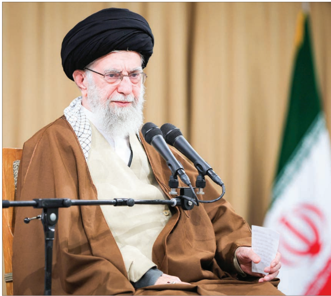
رهبر انقلاب در دیدار دانشمندان، مسئولان و متخصصان صنعت دفاعی کشور