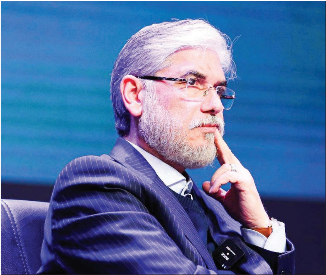
در پی قتل دانشجوی دانشگاه تهران؛